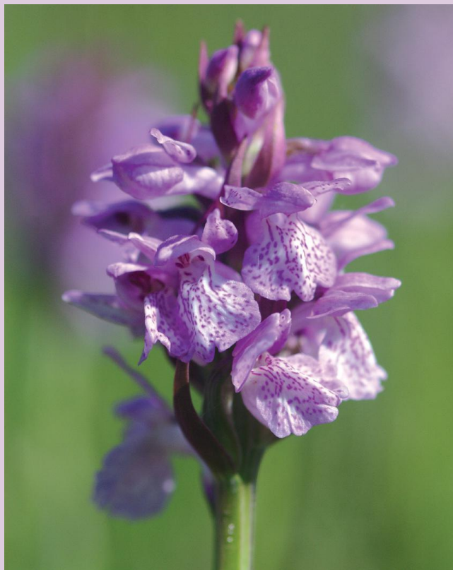
Blütenstand der Torfmoos-Fingerwurz

Die Torfmoos-Fingerwurz wurde erst verhältnismäßig spät als eigene Art beschrieben. Vermutlich ist diese Art auch erst in jüngerer Zeit entstanden. Im Jahr 1927 erschien die Erstbeschreibung des Autors Hans Höppner, der dafür Pflanzen aus Nordrhein-Westfalen zugrunde legte. Er hielt die Torfmoos-Fingerwurz damals für